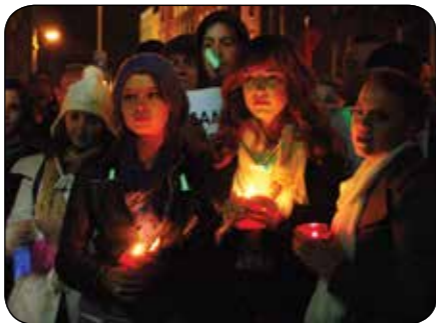
Irish Labour Party

Offrez vos observations sans jugement, à partir du cœur. Avec bienveillance et présence, concentrez votre attention sur ce qui est en train de se produire devant vous plutôt que sur vos propres réactions.