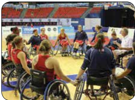
2010 World Wheelchair Basketball Championships

Le cérémoniel est fondamental. Il recentre, connecte et nourrit profondément l'esprit du groupe. Utilisez-le pour marquer ouvertures, transitions, cycles, jalons et en clôture de sessions. Les rituels sont aussi la répétition formelle ou habituelle des pratiques qui ont fait leurs preuves.