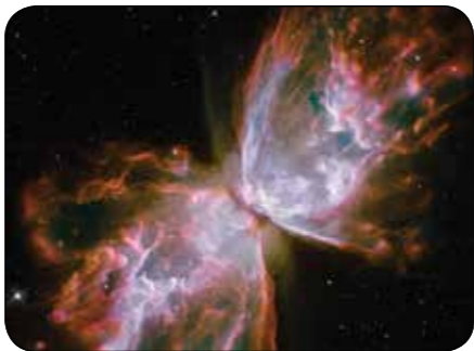
NASA Goddard Space Flight Center