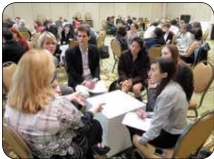
Blue Oxen Associates

Les petits groupes sont parfaits pour l'engagement individuel, pour réaliser des tâches précises et pour créer un espace de partage sécurisant. Les plénières apportent le contexte, le sens et la convergence aux moments critiques. Passez stratégiquement de l'un à l'autre pour tirer avantage de leur nature complémentaire.