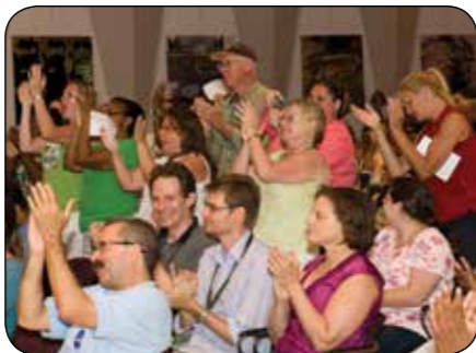
NASA Goddard Space Flight Center

Le feedback, c'est le fait d'offrir et de recevoir de l'information, de différentes manières, pour apprendre et s'adapter. Il peut concerner aussi bien le groupe dans son ensemble que les personnes. Le feedback nous renseigne sur ce qui fonctionne et nous permet d'ajuster le tir pour atteindre nos objectifs.