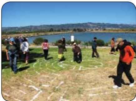
B Hartford J Strong

Travailler avec esprit c'est inviter les forces fondamentales de l'univers à être co-créatrices à nos côtés. Cette perspective plus large nous connecte au sens profond des choses et offre sagesse, inspiration et soutien.