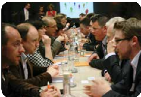
Voka Kamer van Koophandel Limburg

Tout le monde a le droit d'être entendu. Nous détenons toutes et tous un bout de la solution. Ne vous contentez pas de la participation des personnes les plus bavardes, les mieux informées ou les plus anciennes. Allez chercher l'apport de celles qui sont plus hésitantes ou silencieuses.